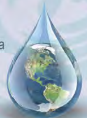
Water born products Produits à base d'eau Productos a base de agua